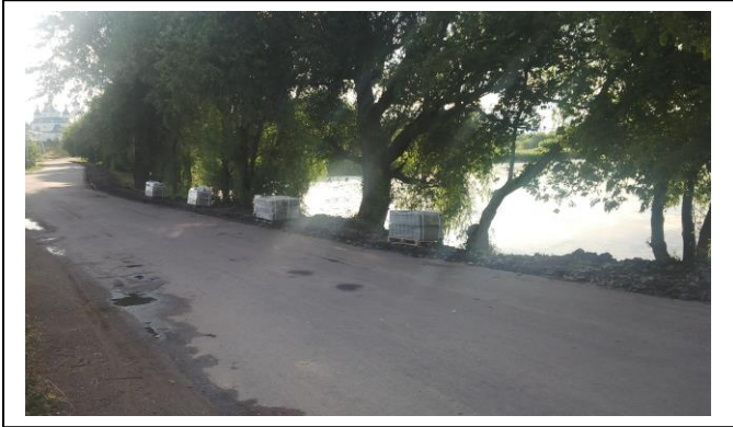
Фото 3 досягнутий результат