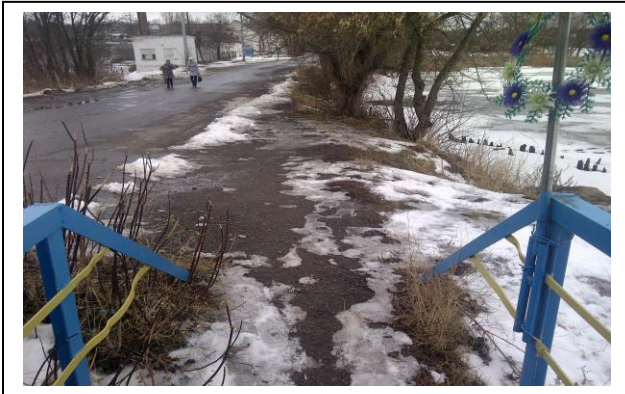
Фото 1 до реалізації проекту

Підтримка людей з обмеженими фізичними можливостями