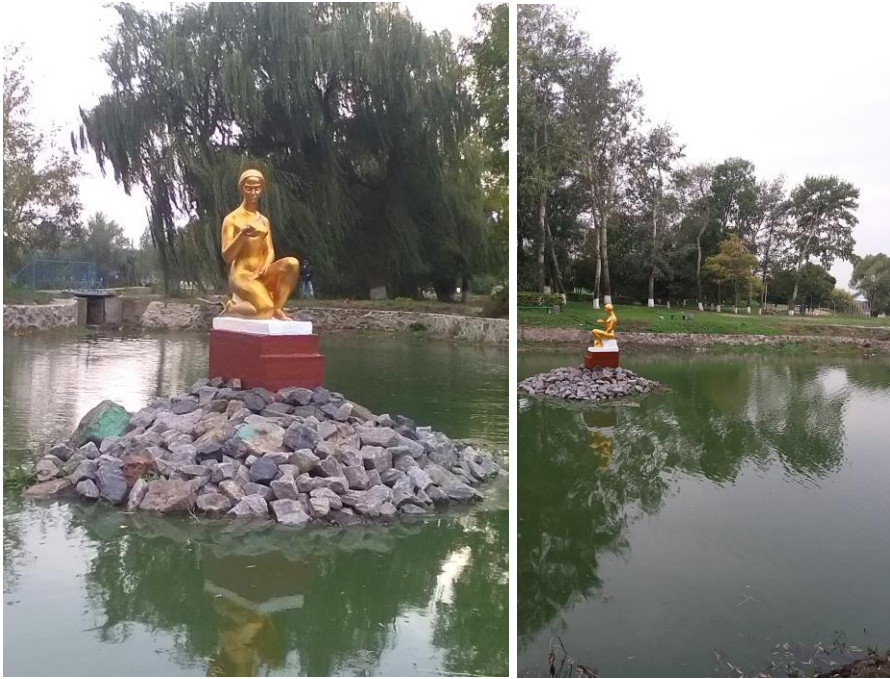
Фото 3 досягнутий результат

Партнери проекту: Іллінецька міська рада, КП «Добробут»