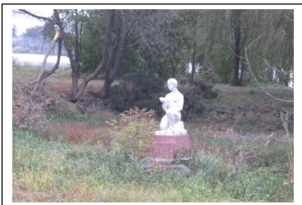
Фото 1 до реалізації проекту

Мета проекту: Очищення природньої водойми, відновлення та збереження екосистеми парку.