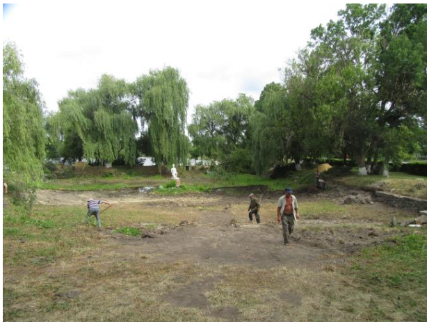
Фото 2 процес реалізації